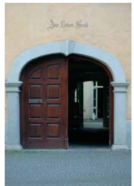
„Zur Lieben Hand“, Löwenstraße 16 (Innenstadt hinter KG I, Universitätsgebäude)

Zu Fuß ab Hauptbahnhof/Hotels in die Löwenstraße in ca. 15 min